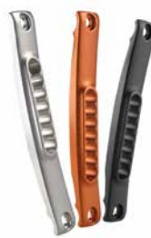
// MÚLTIPLAS POSSIBILIDADES DE PERSONALIZAÇÃO Vingue o seu estilo com uma seleção de 3 cores anodizadas para a placa do eixo e/ou para a forqueta.