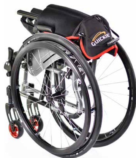
Quickie LIFE com opção de encosto dobrável para a frente