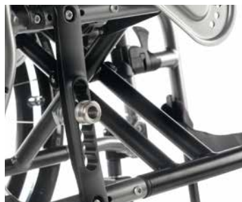
Cruzeta de 3 braços para uma maior robustez

A cruzeta de 3 braços (cruzeta de 4 braços para larguras de 52 e 54 cm) proporciona á cadeira uma grande robustez, com um peso reduzido e um acabamento limpo e minimalista. A Quickie LIFE incorpora além de um inovador sistema de autobloqueio de fechar , fixa automaticamente a posição da cadeira quando fecha para facilitar a sua utilização e abertura. E com dimensões mais compactas!