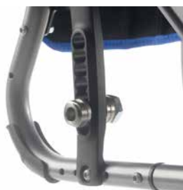
// ALTURA DO ASSENTO AJUSTÁVEL EM 7 POSIÇÕES e com 4 posições do camber (de 0° a 4°).

Na sua configuração standard Quickie LIFE permite um grande número de ajustes: ajustes da altura dianteira e traseira do assento, ajuste do camber, ajuste em ângulo da forqueta... e permite escolher entre uma ampla gama de opções, incluindo apoios de braços, protectores laterais, apoios de pés, travões para fazer com que a tua Quickie LIFE seja única.