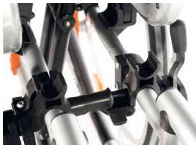
Inovador sistema de fechar