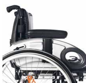
// A MAIS AMPLA GAMA DE OPÇÕES DISPONÍVEIS Como apoios de cabeça, mesas, apoios de braços de escritório ou de hemiplegia, suporte de amputados...