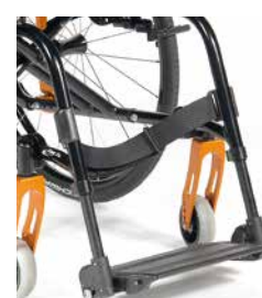
// ESTRUTURA COM APOIO DE PÉS FIXOS Disponível a 105° ou 95° e também com curvatura do apoio de pés de 2 cm.