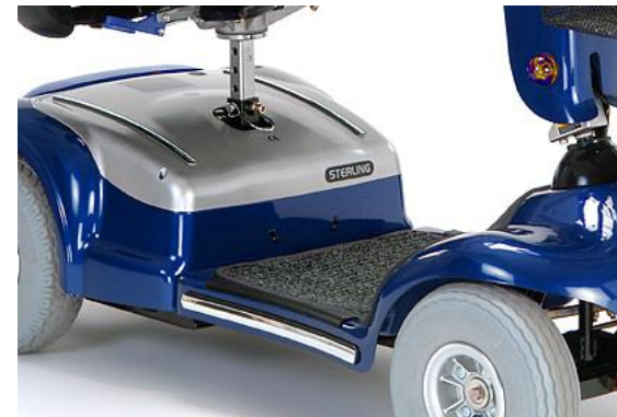
Anterior modelo Sapphire

En la Sapphire 2 se pueden estirar los pies hacia delante, queda un amplio hueco entre las ruedas delanteras