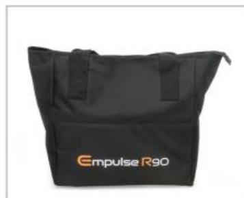
Sac de voyage