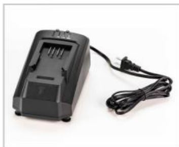
EMN110187: Station d'accueil pour batterie supplémentaire