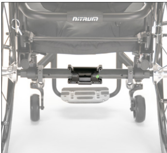
Gniazdo do wózków na ramie sztywnej

SKRZYŃKA KONTROLNA , można zamówić do użytku z prawej lub lewej strony i można go zamontować w dowolnym miejscu na rurze ramy.