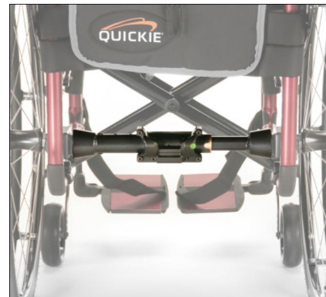
Składany wspornik gniazda dla wózków na ramie składanej