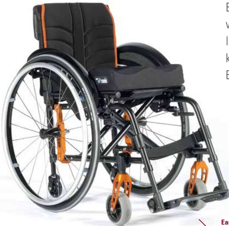
Easy 200 Rahmen mit integrierter Fußraste.

Ein Gesamtkonzept, das immer wieder überzeugt: drei Rahmenlängen, optimale Einstellmöglichkeiten und eine kompakte Bauweise.