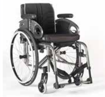
Easy max. Swing Away Rahmen mit abnehm- und wegschwenkbarer Fußraste.

Der Easy max. macht keine Kompromisse: starke Optik, optimale Beinjustierung, abgerundeter Rahmen, flach geformte Radabdeckung – keine Ecken, keine Kanten.