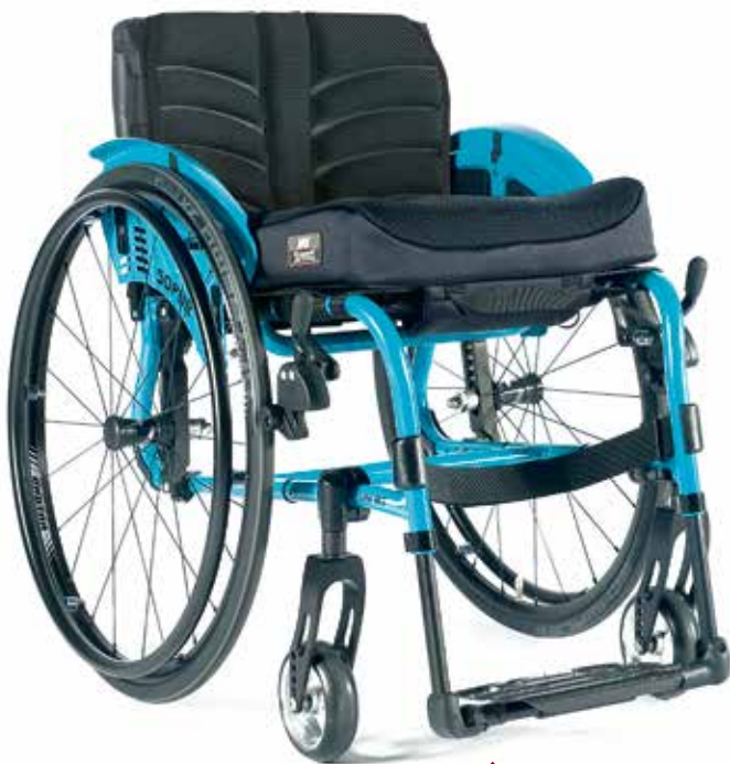
Easy Life RT Rahmen mit integrierter Fußraste.

Stark und zuverlässig: Der Easy Life RT ist dann in seinem Element, wenn er richtig gefordert wird: Der Starrrahmen und beste Fahreigenschaften verleihen ihm die nötige Stabilität.