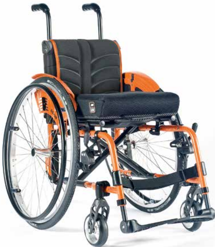
Easy Life T Rahmen mit integrierter Fußraste.