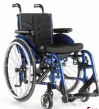
Easy Life T Swing Away Rahmen mit abnehm- und wegschwenkbarer Fußraste.

Der Easy Life T ist der ideale Begleiter für den Alltag: Leicht zu transportieren und dank der Optionsvielfalt individuell auf den jugendlichen Nutzer einstellbar.