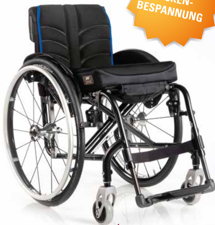
Easy Max. Rahmen mit integrierter Fußraste.