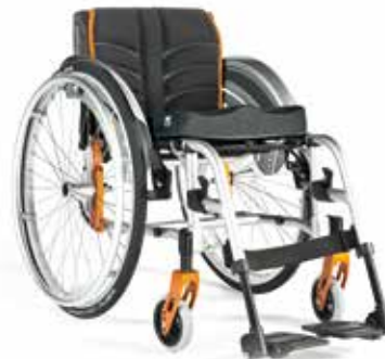
Easy Life RT Swing Away Rahmen mit abnehm- und wegschwenkbarer Fußraste.