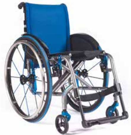
→ Easy max mit Style Paket

Sie wünschen technische Alternativen oder Sonderausstattungen? Sprechen Sie uns einfach an!