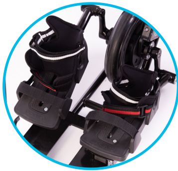
Sandálias resistentes e ajustáveis