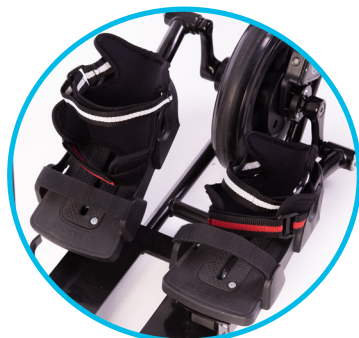
Sandalias resistentes y ajustables