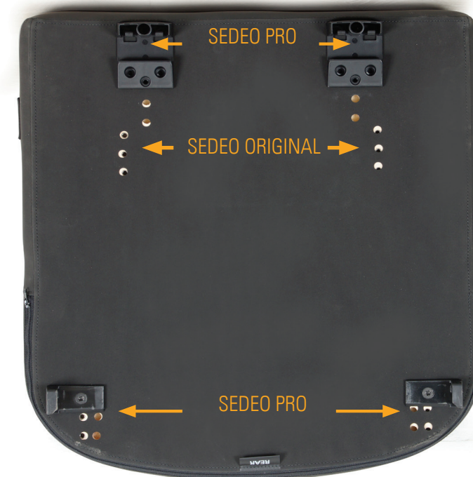
SEDEO PRO IBIS ET PUMA 20/40