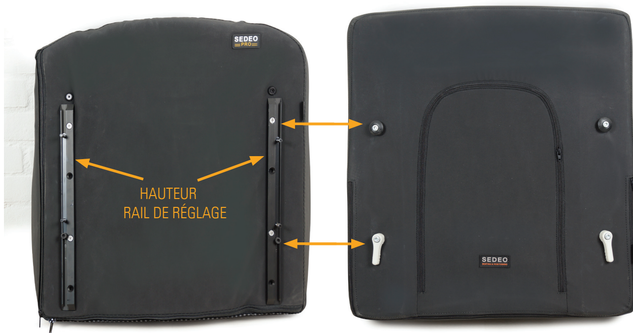
SEDEO PRO Q-SERIE

1010889 kit de montage pour coussins de dos SEDEO PRO 1014586 kit de fixation du dossier SEDO ORIGINAL