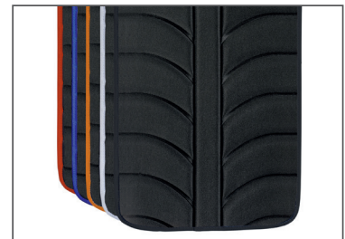
EXO EVO – the evolution of back upholstery