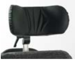
// CIR030066 + CIR030138