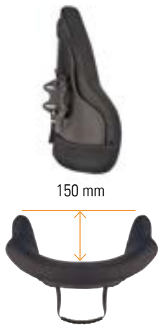
// Becken Tiefe Kontur (PDC)