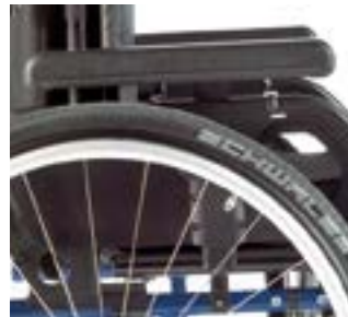
// LEC040054 Seitenteil mit Arm- polster (300 mm), höhen- und tiefenverstellbar