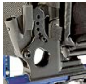
// LEC030023 und LEC030025 Rückenwinkeleinstellbar (-5° bis 25°)