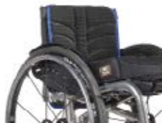
// LEC030317 EXO PRO Rückenbespannung (Exo Evo Version)