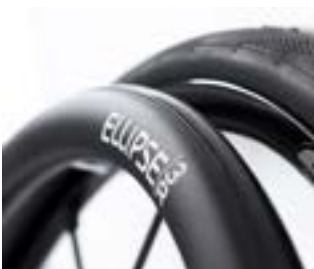
// LEC070212 Ellipse 3R