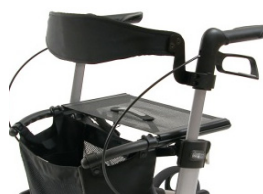
// 7109020 & 7109021 Encosto (2) (3)