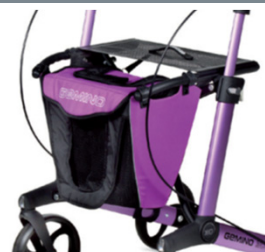
// 7104023 (1) Violeta/preta