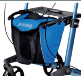
// 7104022 (1) Azul/preta