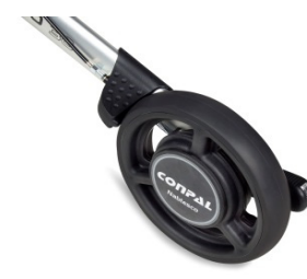
// 9009329 (2) Rodas SpeedControl

(1) Não disponível para Geminos 60 M/60 M Walker. (2) Não disponível para Geminos 60 / 60 M e Gemino 60 Walker/60 M Walker.