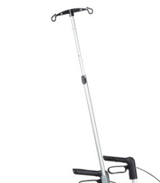
// 7109100 Suporte de soro