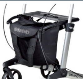
// 7104006 (1) & 7104007 Bolsa Advance com tampa e pegas preta