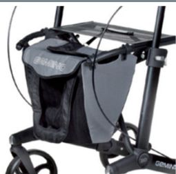
// 7104025 (1) Cinzenta / preta