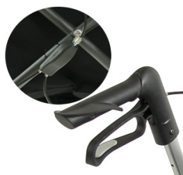
// 7109071 (2) Travão de uma só mão