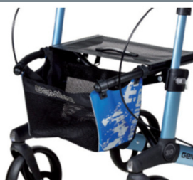
// 7104032 Bolsa estampada azul/preto