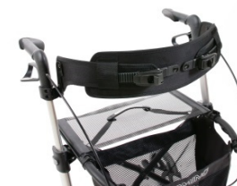
// 7109035 (3) Encosto ajustável confort