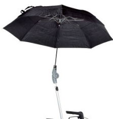
// 7109060 Chapéu de Chuva em preto