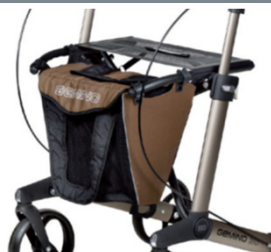
// 7104024 (1) Castanha / preta