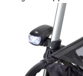
// 7109095 Luz