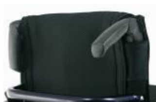
XFF 030203 Körhandtag fällbara