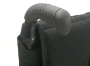
XFF 030201 Körhandtag långa