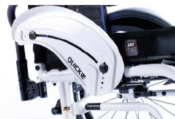
XFF040103 Sidoskydd aluminium, med stänkskärm