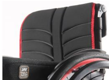
XFF 030316 EXO Evo ryggklädsel