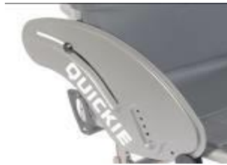
XFF040102 Sidoskydd, aluminium, utan stänkskärm