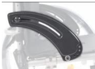
XFF040101 Sidoskydd, kolfiber, utan stänkskärm