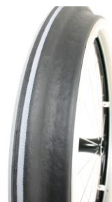
XFF070208 Drivring Maxgripp (ergo para cp modell)