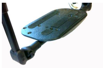
XFF050131 Fotplatta hel, komposit