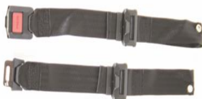
XFF 090018 Positioneringsbälte med låsning