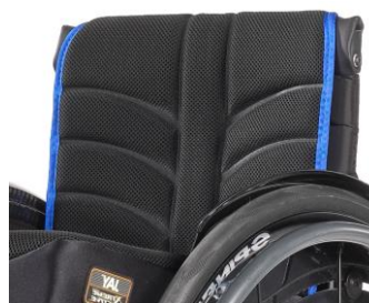
XFF 030317 EXO PRO Evo ryggklädsel