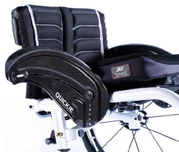
XFF040104 Sidoskydd kolfiber med stänkskärm