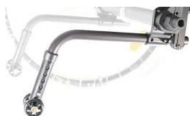
XFF090050 Tippskydd, löstagbara plug in