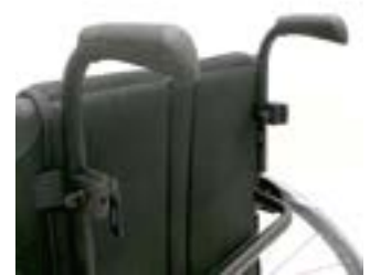
// LRT030204 Schiebegriffe höhenverstellbar