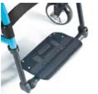
// LRT050026 Durchgehend, Leichtgewicht, Carbon, winkel- / tiefeneinstellbar