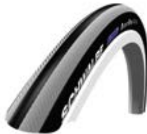
// LRT070101 Schwalbe Right Run Feinprofil