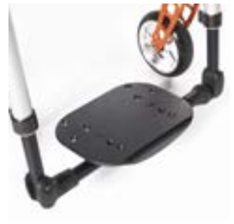
// LRT050131 Durchgehend, Leichtgewicht, Kunststoff, tiefeneinstellbar