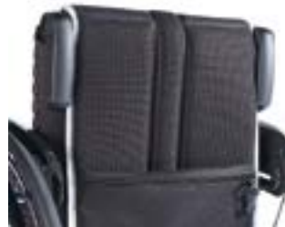
// LRT030203 Schiebegriffe abklappbar