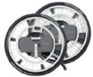
// WDO000201 WheelDrive