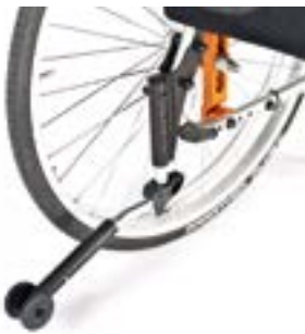
// LRT090004 Sicherheitsrad, abschwenkbar, links