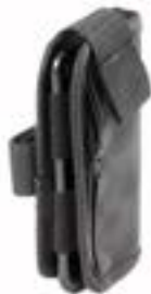
// LRT090026 Handytasche