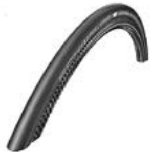
// LRT070107 Schwalbe One