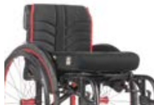
// LRT030316 EXO Rückenbespannung (Exo Evo Version)