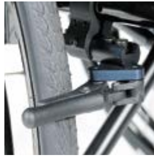
// LRT060003 Kompaktbremse