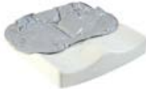
// JAY020007 JAY Easy Fluid Kissen (Bild zeigt Kissen ohne Bezug)