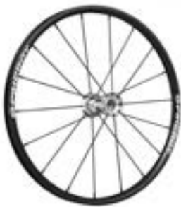
// LRT070005 Antriebsrad, Spinergy, 18 Speichen (schwarz), gerade verspeicht, Nabe: silber