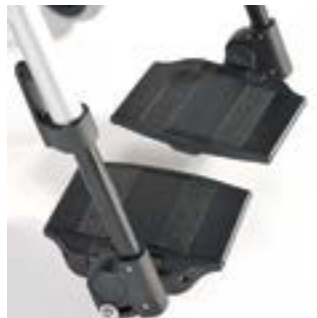
// LRT050050 Fußbrett geteilt Aluminium