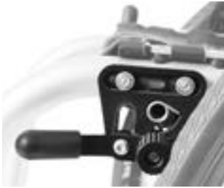
// LRT060001 Standardbremse