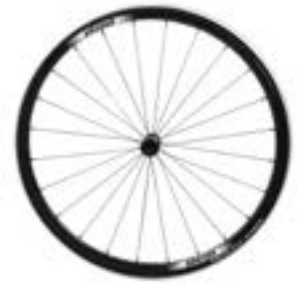
// LRT07004 Antriebsrad, Proton, 24 Speichen, gerade verspeicht