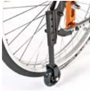
// LRT090010 Transitrollen