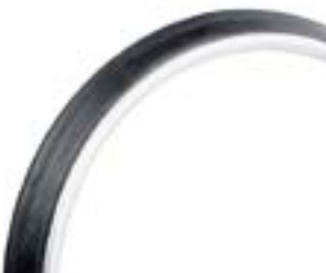
// LRT070208 Max Grepp®