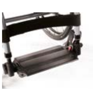
// LRT050062 Verriegelung, Fußbrett durchgehend, Aluminium