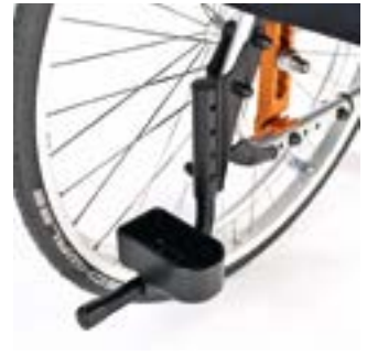
// LRT090009 Stockhalter, Schlaufe