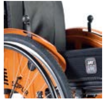
// LRT060013 Druckbremse im Seitenteil integriert, Safari