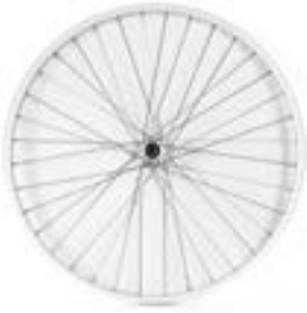
// LRT070001 Antriebsrad Universal, 36 Speichen, kreuzförmig verspeicht