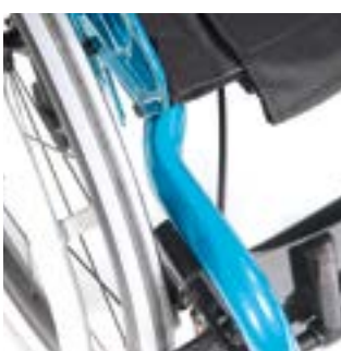
// LRT010023 FF 105°, integrierte Fußraste, 25 mm je Seite abduziert