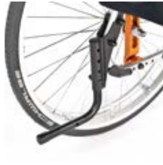
// LRT090001 Ankippbügel, links