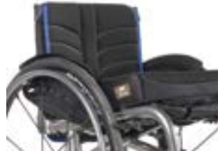
// LRT030317 EXO PRO Rückenbespannung (Exo Evo Version)