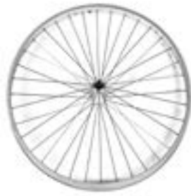
// LRT070002 Antriebsrad, Design, 36 Speichen, gerade verspeicht