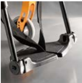
// LRT050020 Fußbrett, geteilt, Kunststoff