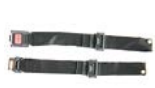
// LRT090018 Beckengurt mit Gurtverschluss, Metall