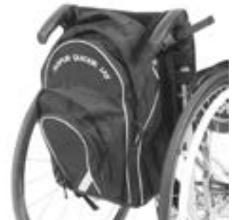
// LRT090030 Rucksack