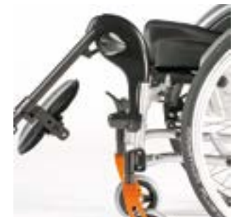
// LRT050009 Fußbretthalter, Aluminium, hochschwenkbar (0° - 90°), abschwenkbar