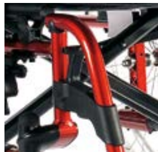
// LRT050004 Fußbretthalter, Kunststoff, abschwenkbar, 100°