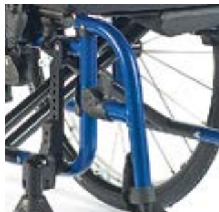
// LRT050007 Fußbretthalter, Aluminium, abschwenkbar, 100°