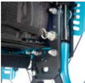
// LRT030015 Rücken, winkleinstellbar, Verriegelung in abgeklapptem Zustand