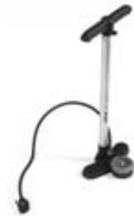
// LRT090024 Standpumpe, Hochdruck