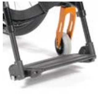
// LRT050102 Fußbrett durchgehend Aluminium