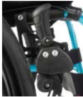
// LRT060002 Kniehebelbremse