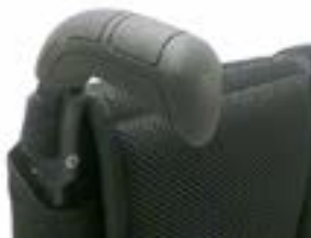
// LRT030201 Schiebegriff, lang