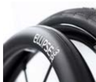
// LRT070212 Ellipse 3R