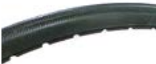
// LRT070102 Pannensichere Bereifung