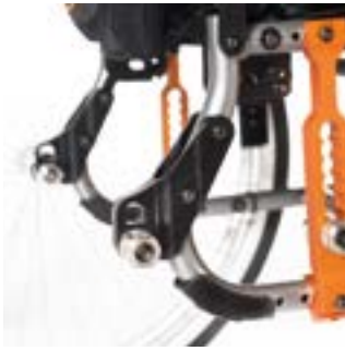
// LRT010500 Radstandsverlängerung für Anklembike