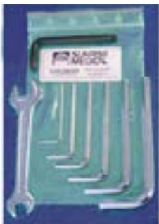
// LRT090000 Werkzeugsatz