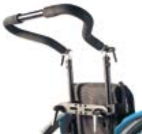
// LRT030208 Schiebebügel höhenverstellbar, breiteneinstellbar und winkelverstellbar (ab RH 30 cm)