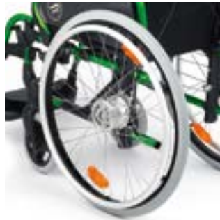
// LRT070008 Antriebsrad, Trommelbremse, 36 Speichen, kreuzförmig verspeicht