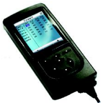
SAL090020 / SAL090021