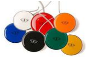
STR110191 - STR110198