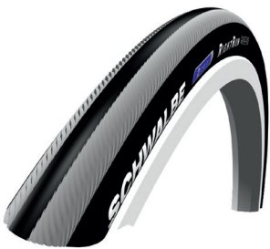
// ZRS070101 Schwalbe Right Run Feinprofil