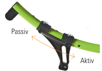
// Aktiv: Leichtes Ankippen, gutes Manövrieren; Passiv: sehr kipps stabil, langer Radstand