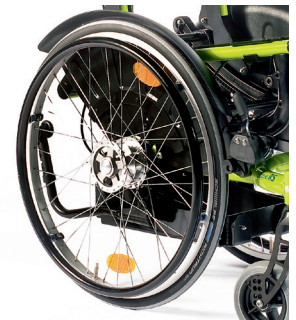
// ZRS070008 Antriebsrad mit Trommelbremse, 36 Speichen