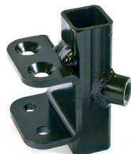
// ZRS040052 Seitenteilaufnahme