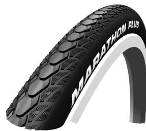
// ZRS070104 Marathon Plus Evolution