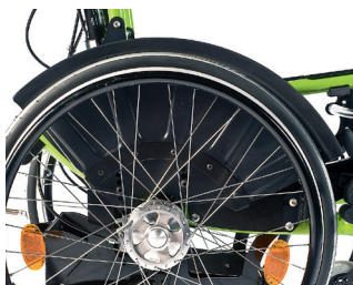
// ZRS040109 Radabdeckung Kunststoff