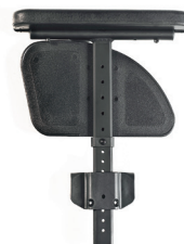
// ZRS040125 Seitenteil Zentralstütze, Armpolster