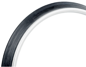
// ZRS070208 Maxgrepp®