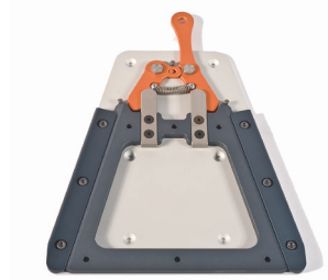
// ZRS020151 Trapezadapter