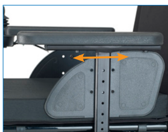
Almofada do apoio de braço super macia, ajustável em profundidade em 3 posições