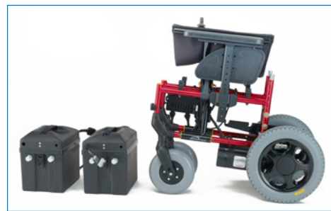
Uma vez tiradas as baterias e desmontado o encosto, a cadeira encaixa de uma forma muito compacta.

As rodas anti-queda desmontam-se facilmente para retirá-las quando não forem necessárias.