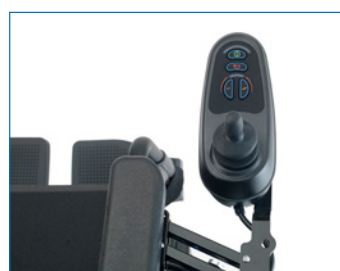
Comando rebatível em paralelo, o que facilita o acesso às mesas.