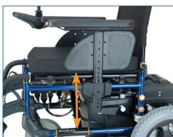
Apoios de braços ajustáveis em altura com ferramentas para um maior conforto.

F35 R2 é adaptável às necessidades de cada utilizador. Os apoios de braços podem ser ajustados em altura mediante ferramentas e o seu almofadado bastante acolchoado pode ser colocado em 3 posições para garantir o conforto em todos os momentos. Além disso, o comando pode ser rebatível para facilitar o acesso às mesas.