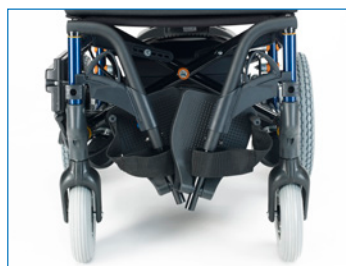
Apoio para os pés desmontável e rebatível para dentro.