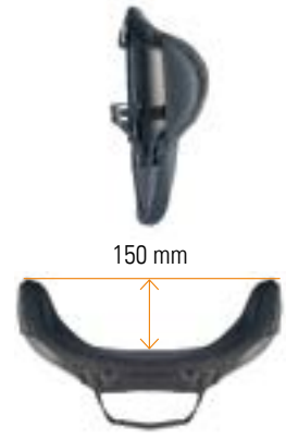
// Mittlere Tiefe Kontur (DC)