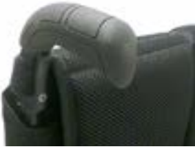
// LRF030201 Schiebegriff, lang