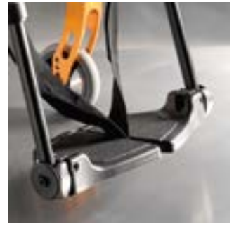
// LRF050020 Fußbrett, geteilt, Kunststoff