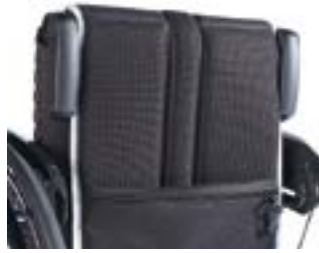
// LRF030203 Schiebegriffe abklappbar