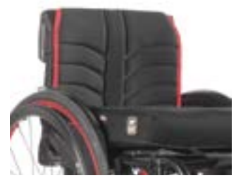
// LRF030316 EXO Rückenbespannung (Exo Evo Version)