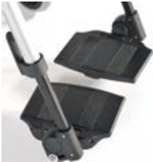
// LRF050050 Fußbrett, geteilt, Aluminium