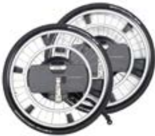
// WDO000201 WheelDrive