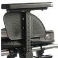
// LRF040052 Seitenteil Zentralstütze, Armpolster, tiefen- und höhenverstellbar