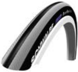
// LRF070101 Schwalbe Right Run Feinprofil