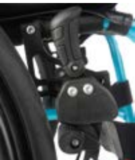
// LRF060002 Kniehebelbremse