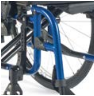
// LRF050001 + LRF 050007 Fußbretthalter Aluminium 100°