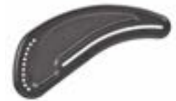
// LRF040102 Aluminium, Kälteschutz