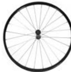
// LRF070003 Antriebsrad, Leichtge- wicht, 24 Speichen, gerade ver- speicht