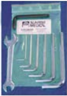
// LRF090000 Werkzeugsatz