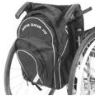
// LRF090030 Rucksack