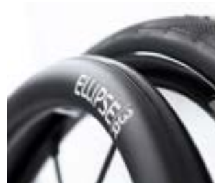
// LRF070212 Ellipse 3R