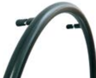
// LRF070207 Supergrip