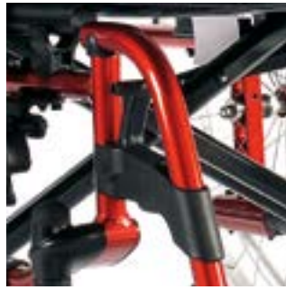
// LRF050001 + LRF050004 Fußbretthalter Kunststoff 100°