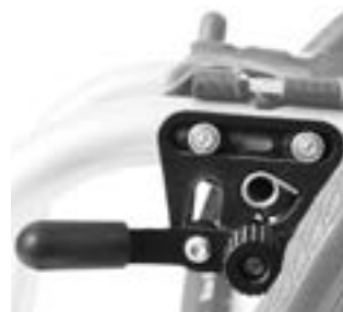
// LRF060001 Standardbremse