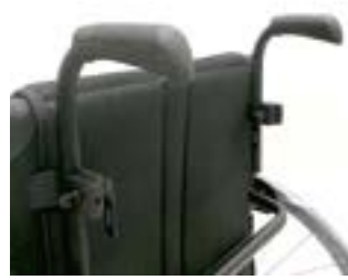
// LRF030204 Schiebegriffe höhenverstellbar