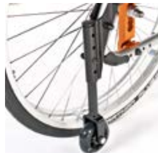
// LRF090010 Transitrollen