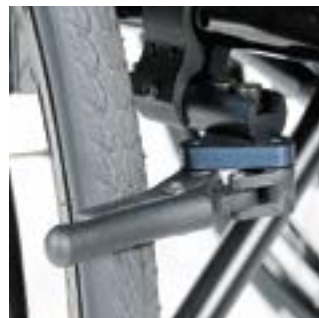
// LRF060003 Kompaktbremse