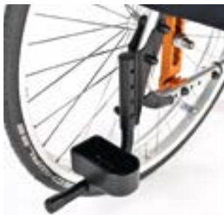
// LRF090009 Stockhalter, Schlaufe