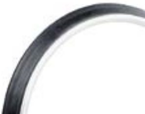
// LRF070208 Maxgripp