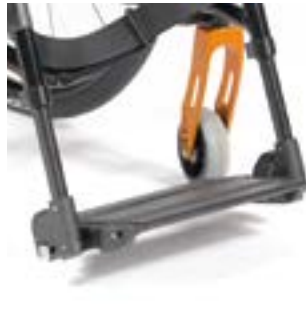
// LRF050102 Fußbrett, durchge- hend Aluminium