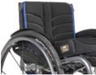
// LRF030317 EXO PRO Rückenbespannung (Exo Evo Version)