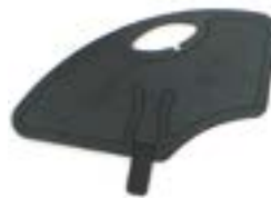
// LRF040107 Kunststoff, abnehmbar