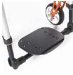
// LRF050131 Leichtbau-Fußbrett durchgehend, winkleinstellbar Kunststoff, hochklappbar