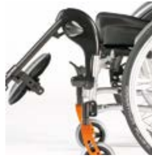
// LRF050009 - LRF050010 Fußraste, Aluminium, hochschwenkbar