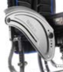
// LRF040103 Aluminium, Kleiderschutz, Kälteschutz