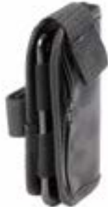
// LRF090026 Handytasche