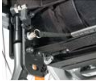
// LRF030102 Rücken, winkelein- stellbar, Verriegelung in abgeklapp- tem Zustand