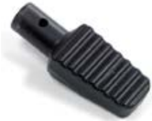
// RUB090119 Ankipphilfe (Paar)