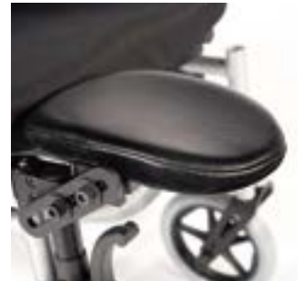
// RUB050008 Stumpfauflage (Paar)