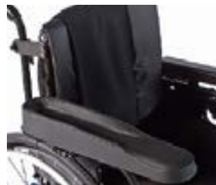
// RUB040005 Hemi-Armauflage XL (tiefen- und winkelverstellbar)