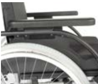
// RUB040002 Seitenteil mit Armpolster