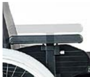
// RUB040004 Seitenteil Zentralstütze, Armpolster