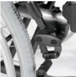
// RUB060001 Kniehebelbremse