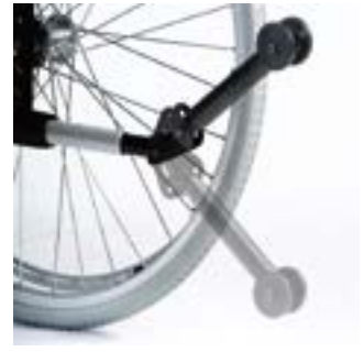
// RUB090115 Sicherheitsrad, aufsteckbar