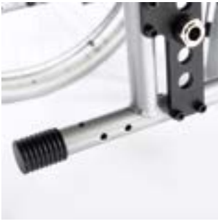
// RUB090119 Ankippbügel (Paar)