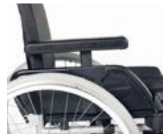
// RUB040003 Seitenteil mit Armpolster höhenverstellbar