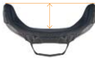
// Tiefe Kontur (DC)