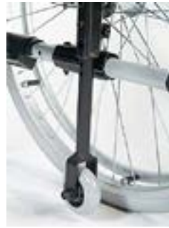
// RUB090106 Transitrollen