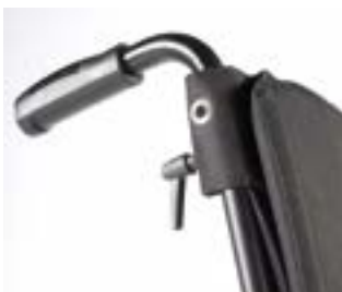
// RUB030018 Höhenverstellbare Schiebegriffe