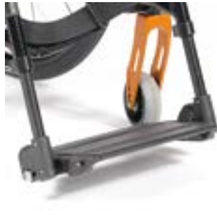
// RUB050002 Fußbrett durch- gehend Aluminium