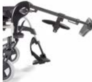
// RUB050003 Fußbretthalter, Alu- minium, hochschwenkbar (0° - 90°), abschwenkbar