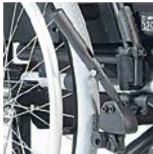
// RUB060004 Einhandbremse