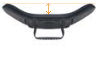
// Mittlere Kontur (MC)