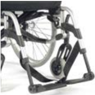
// RUB050001 Fußraste geteilt winkleinstellbar, Kunststoff, mit Fersenband