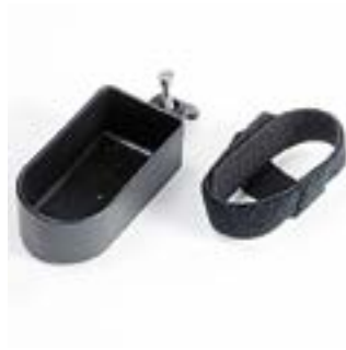
// RUB090102 Stockhalter, Schlaufe