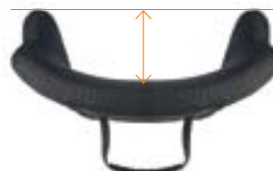
// Mittlere Tiefe Kontur (MDC)