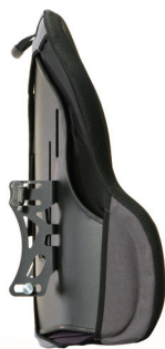
Posterior Deep Contour