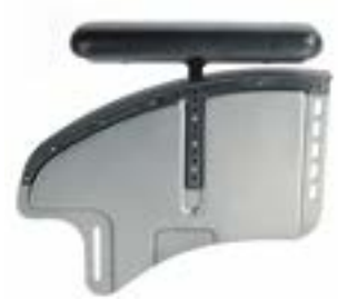
// ESY040010 Aluminium Seitenteil mit Kleiderschutz ESY040012 & Armpolster ESY040015