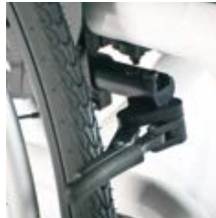
// EAY060003 Kompaktbremse