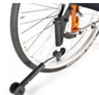
// EAY090006 Sicherheitsrad, abschwenkbar