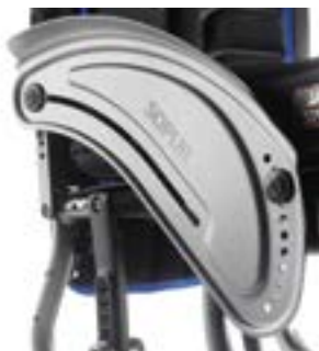
// EAY040014 Aluminium Seitenteil mit Kleiderschutz in Rahmenfarbe