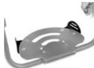
// EAY050012 Seitenschutz, einstellbar zur seitlichen Abgrenzung der Fußraste