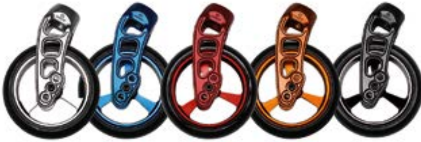
// EAY080001 Carbotecture Gabel