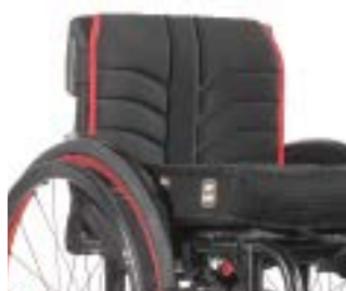
// EAY030316 EXO Rückenbespannung (Exo Evo Version)