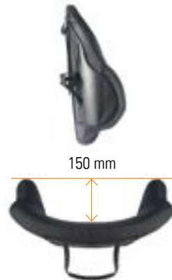
// Mittlere Tiefe Kontur (MDC)