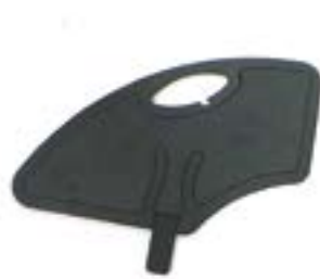
// EAY040009 Kunststoff Seitenteil aufsteckbar