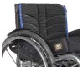
// EAY030317 EXO PRO Rückenbespannung (Exo Evo Version)