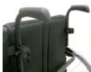
// EAY030018 Schiebegriffe höhenverstellbar