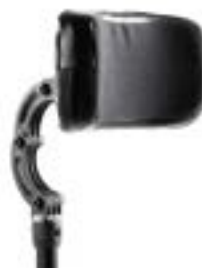
// EAY030023 Kopfstütze, groß, höhen- / tiefen- / winkelverstellbar, 230 x 110 mm