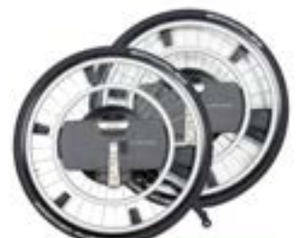
// WDO000201 WheelDrive Plus