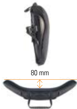
// Mittlere Kontur (MC)