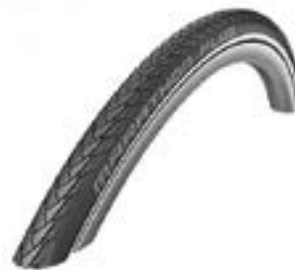
// EAY070019 Schwalbe Marathon Plus Evolution, pannengeschützt