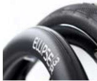
// ESY070212 Ellipse 3R