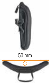
// Flache Kontur (SC)