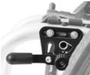
// EAY060001 Standardbremse