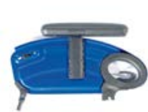
// EAY040004 Deskseitenteile hochschwenkbar und abnehmbar