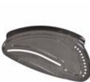
// EAY040104 Carbon Seitenteil mit Kleiderschutz schwarz