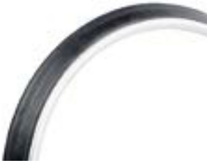
// EAY070037 Maxgrepp