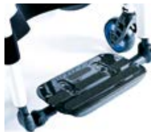
// EAY050033 Carbon Fußbrett