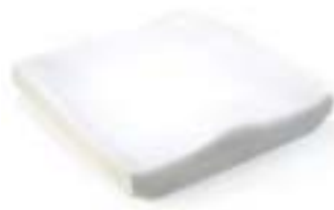
// JAY020002 JAY Basic Kissen (Bild zeigt Kissen ohne Bezug)