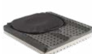
// JAY020004 JAY Lite Kissen (Bild zeigt Kissen ohne Bezug)