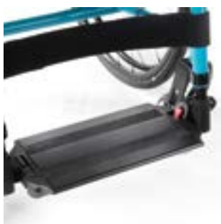
// EAY050062 Verriegelung, Fußbrett durchgehend, Aluminium