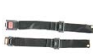
// EAY020016 Beckengurt mit Gurtschloss, Metall