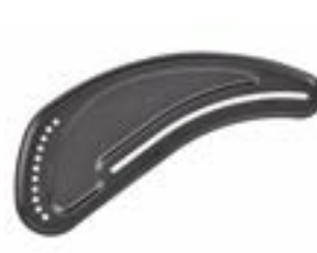
// EAY040013 Aluminium Seitenteil ohne Kleiderschutz