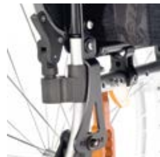
// EAY030112 Fest winkleinstellbarer Rücken 80° - 105°