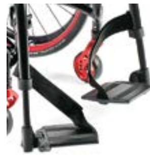
// EAY050007 Fußbrett geteilt, Aluminium