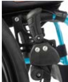
// EAY060002 Kniehebelbremse