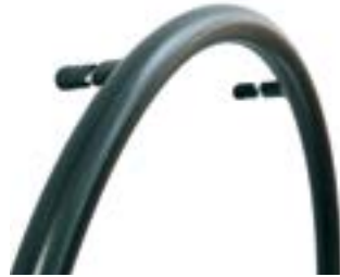
// ESY070036 Supergrip