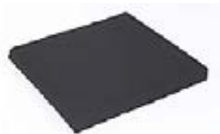
// Sitzkissen, Bezug mit Reißverschluss, schwarz