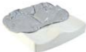
// JAY020007 JAY Easy Fluid Kissen (Bild zeigt Kissen ohne Bezug)