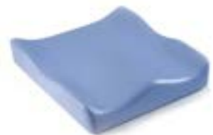
// JAY020003 JAY Soft Combi P Kissen (Bild zeigt Kissen ohne Bezug)