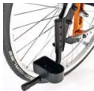
// EAY090003 Stockhalter, Schlaufe (nur möglich in Verbindung mit Ankippbügel)