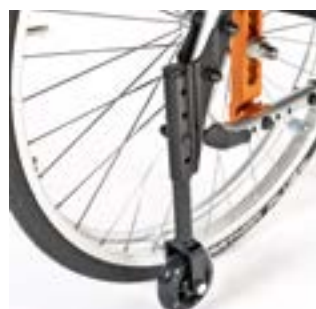
// EAY090005 Transitrollen