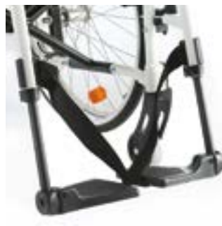
// EAY050006 Fußbrett geteilt, Kunststoff winkelverstellbar