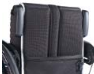
// EAY030017 Schiebegriffe abklappbar