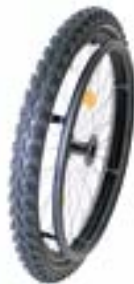
// EAY070007 Mountainbike Rad