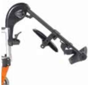
// EAY050014 Fußbretthalter hochschwenkbar (ELR)