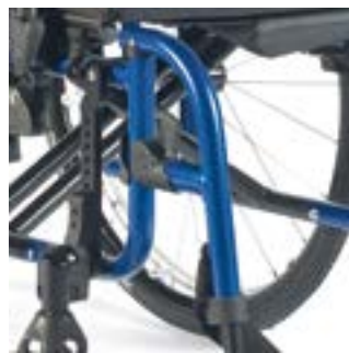
// EAY050002 Fußbretthalter Aluminium 100°