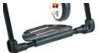
// EAY050010 Aluminium-Fußbrett Xenon Performance