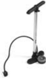
// EAY090011 Standpumpe, Hochdruck