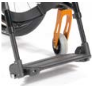
// EAY050008 Fußbrett durchgehend, Aluminium