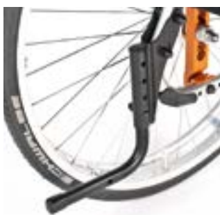
// EAY090001 Ankippbügel